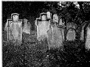
Hřbitov (stará část)