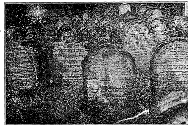
Hřbitov (stará část)