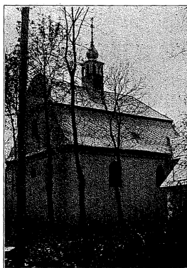
Tempel in Raubowitz (Außenansicht)